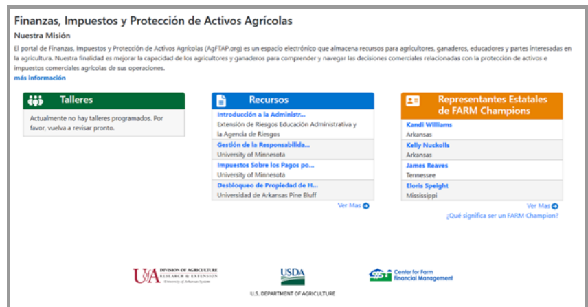
Gráfico 2. AgFTAP.org, Misión y Recursos Disponibles

En el menú Talleres se encuentran las capacitaciones disponibles de forma presencial o en línea. El usuario puede seleccionar los talleres a los que desea asistir seleccionando un Estado específico y el tipo de programas (Gráfico 3). Las áreas en las que se ofrecen talleres son las siguientes: protección de activos, estructuras empresariales, propiedad de herederos/terrenos fraccionados, planificación patrimonial e impuestos, planificación fiscal agrícola, Formularios 1099, Anexo F (Formulario 1040), asistencia para el servicio de préstamos, finanzas agrícolas y mantenimiento de registros. Un listado de las próximas capacitaciones y talleres se muestran en esta sección e incluyen una breve descripción, afiliaciones del educador o presentador, la fecha, el tipo de taller (seminario web,