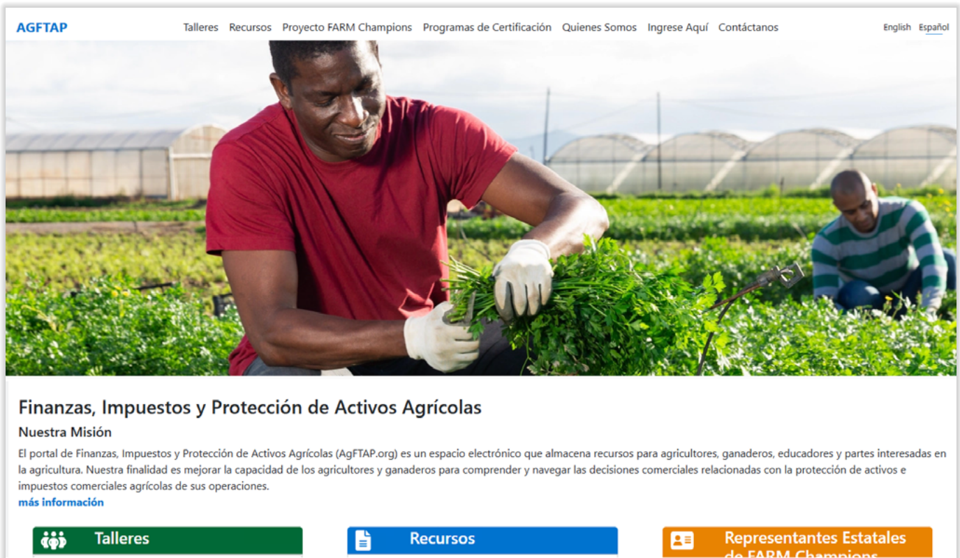
Gráfico 1. AgFTAP.org, Página de Inicio

ponible una versión en español ( https://agftap.org/ ). El portal AgFTAP utiliza un sistema de navegación intuitivo con menús que permite a los usuarios explorar talleres del programa, cursos en línea (gratuitos), recursos impresos y en video, y la red FARM Champions.